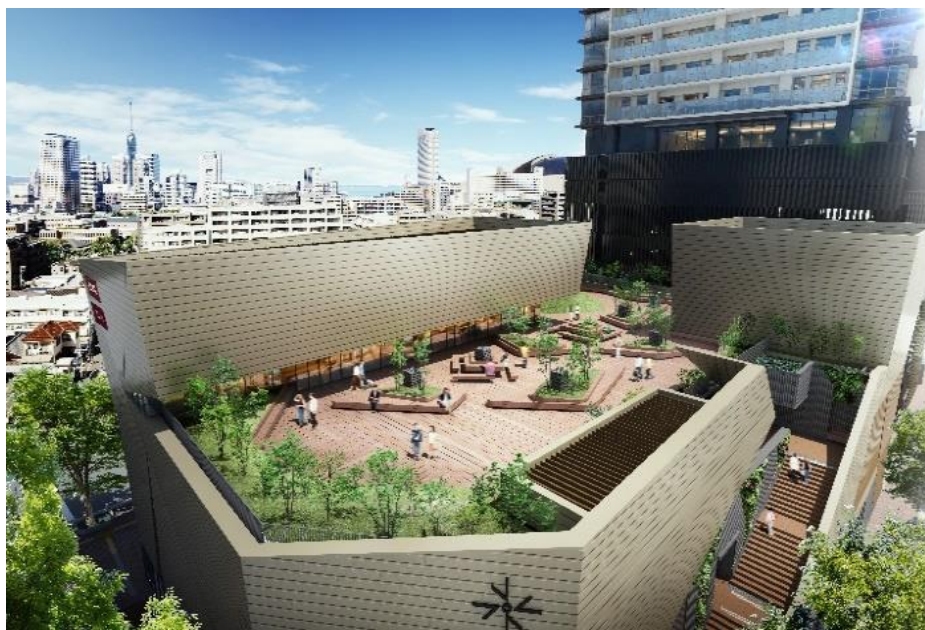
屋上庭園「ROOF GARDEN」イメージ

商業棟「PRALIVA」には、地域の方々にご利用いただける屋上庭園「ROOF GARDEN」を設置します。人々の交流を育み、訪れる人々に快適な空間を提供することで、地域の憩いの場として愛される場所となることを目指します。