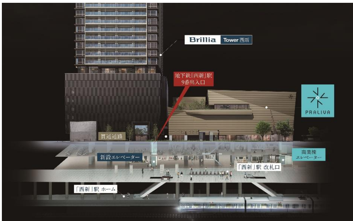
地下鉄「西新」駅9番出入口、Brillia Tower 西新との接続イメージ

住宅棟「Brillia Tower 西新」と地下鉄「西新」駅コンコースを接続し、新たな出入口（9番）としてエレベーター（2基）を新設することで、地下鉄「西新」駅のバリアフリー動線の更なる拡充に寄与し、地域の利便性を高めます。