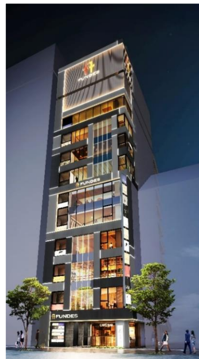
※「FUNDES銀座」外観イメージ