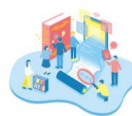
まなびのコンテンツ

コミュニティごとの学習ニーズに合った学習環境や仕組みを、学習者の視点からデザインします。