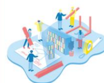
まなびの空間づくり

学術情報への円滑なアクセス環境の構築と、学習機会の最大化を通して、学習・研究活動を支援します。