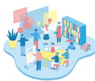
まなびの場の企画・運営

また、セミナールーム(50人収容)を併設し、まなびに関わるワークショップなどを実施してまいります。