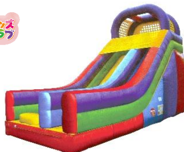
【ふわふわスライダー】